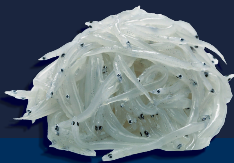
Novellame di pesce ghiaccio