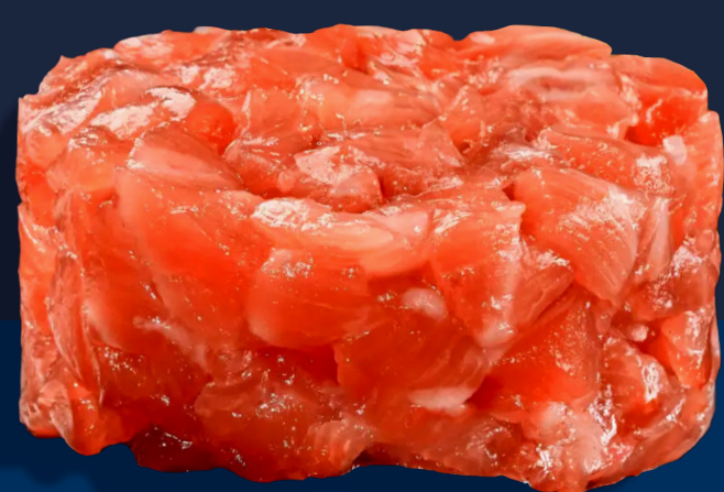
Tartare di gambero rosso, ricciola, tonno