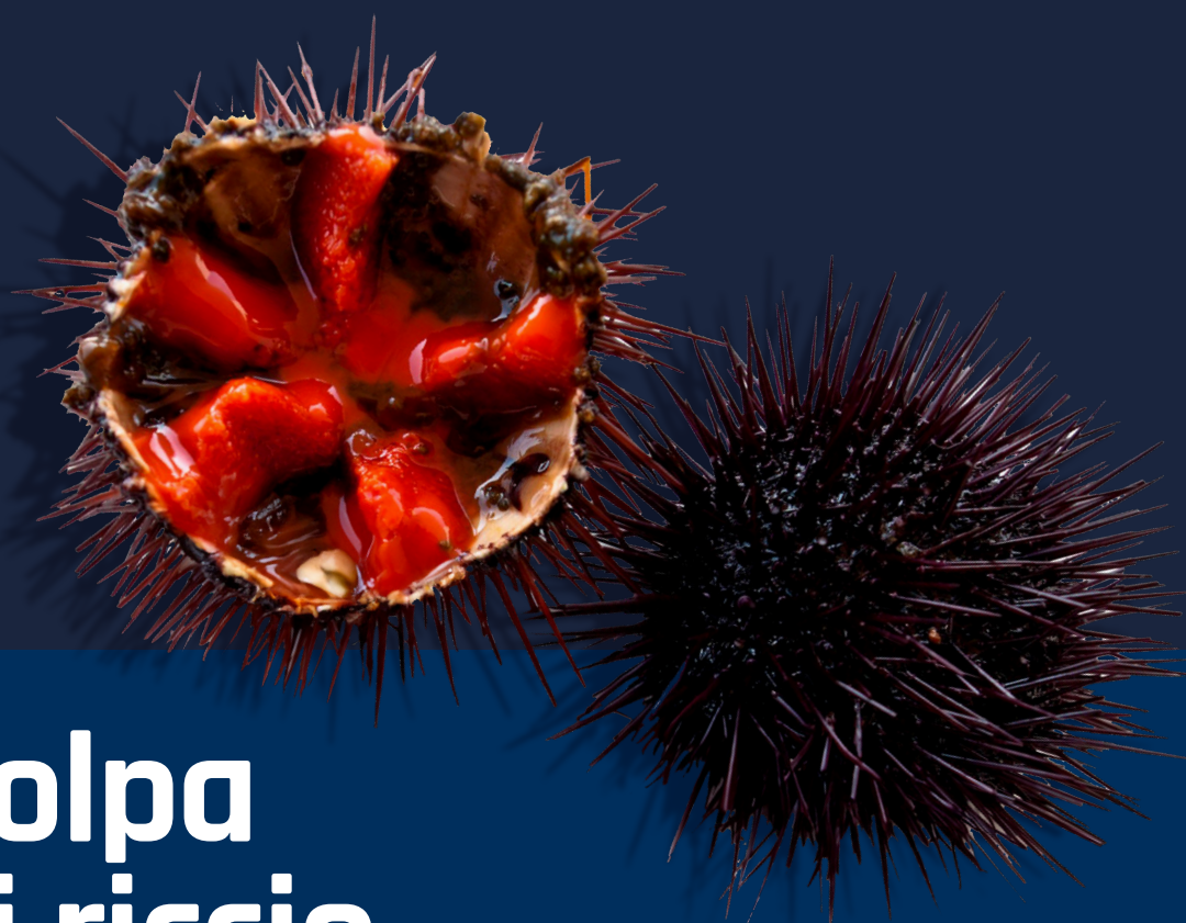
Polpa di riccio