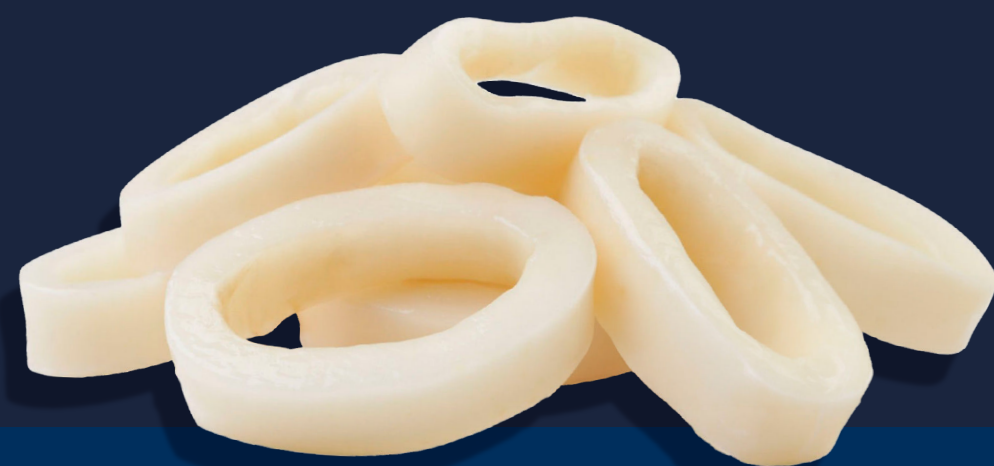
Anelli di totano Atlantico